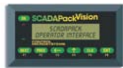
Панель SCADAPack Vision10

Имеются две модели операторских панелей: SCADAPack Vision10, SCADAPack Vision60, одинаковые по своей функциональности, но отличающиеся объемом памяти, размерами экрана и количеством программируемых клавиш.