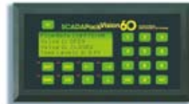
Панель SCADAPack Vision60