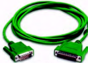
Код заказа EA-4CBL-1