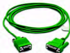
Код заказа EA-2CBL-1