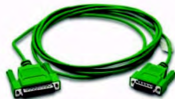
Код заказа EA-SLC-232-CBL