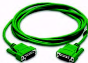
Код заказа EA-90-30-CBL