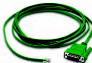
Код заказа EA-3CBL