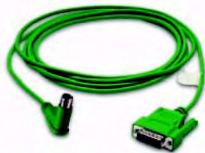
Код заказа EA-MLOGIX-CBL