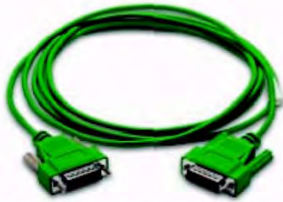
Код заказа EA-4CBL-1