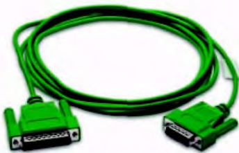
Код заказа EA-PLC5-232-CBL