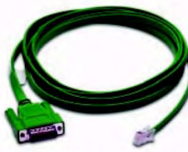
Код заказа EA-DH485-CBL