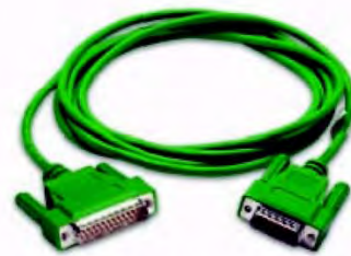
Код заказа EA-MITSU-CBL