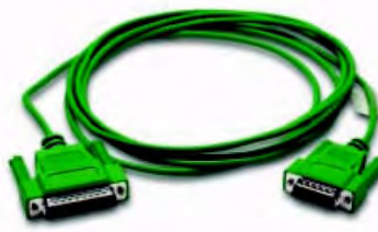
Код заказа EA-OMRON-CBL