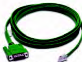
Код заказа EA-2CBL