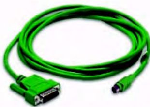
Код заказа EA-MITSU-CBL-1