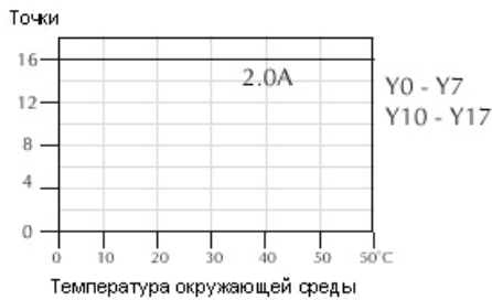
График снижения номинальных характеристик в зависимости от температуры для релейных выходов