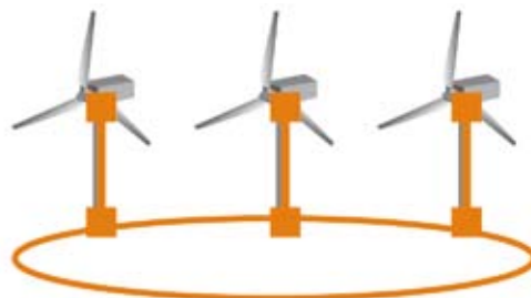
Два одномодовых оптических порта применяются для объединения ветровых электростанций в кольцо, а один оптический порт – для подключения к турбине.

3 оптических SFT порта отлично подходят для использования на ветряной электростанции. MSR резервированные кольца и механизм защиты от широкоэвещательных штормов обеспечивают стабильную и надежную работу сети.